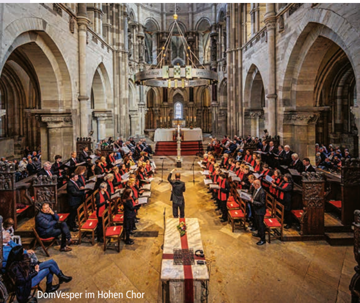
DomVesper im Hohen Chor