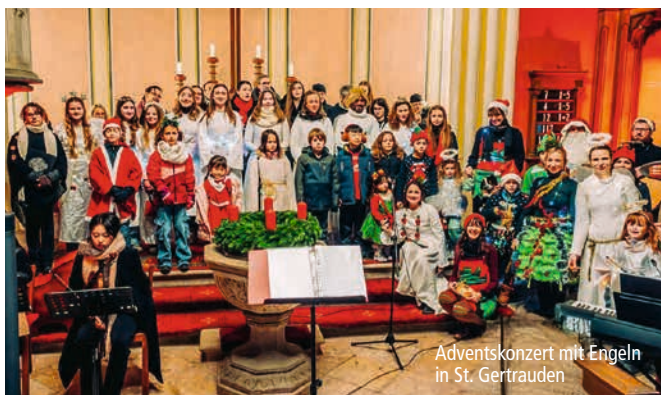
Adventskonzert mit Engeln in St. Gertrauden

13. DEZEMBER 16.00 Uhr, St. Gertrauden, Buckau 9