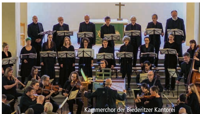
Kammerchor der Biederitzer Kantorei