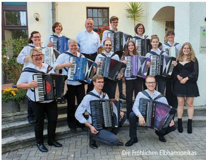
Die Fröhlichen Elbharmonikas

9. JUNI 16.00 Uhr, Kreuzkirche, Nordwest 20