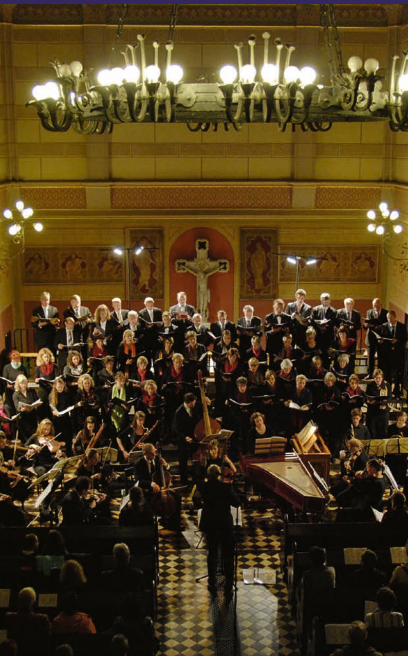
Biederitzer Kantorei und Cammermusik Potsdam in der Pauluskirche