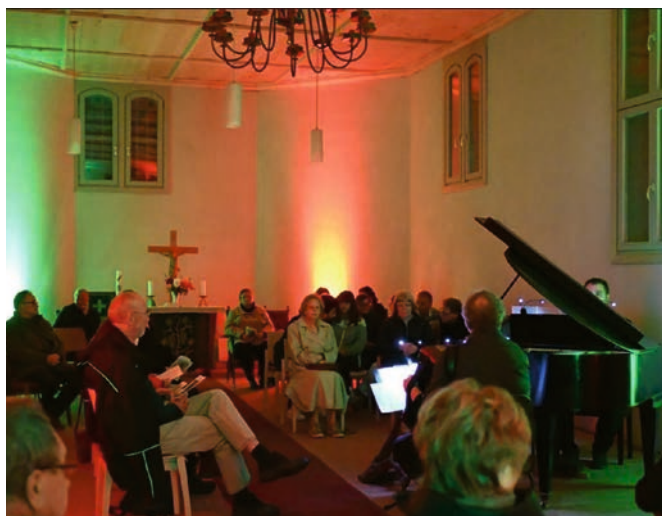
Fermersleber Abend, Kammermusik in der Martin-Gallus-Kirche