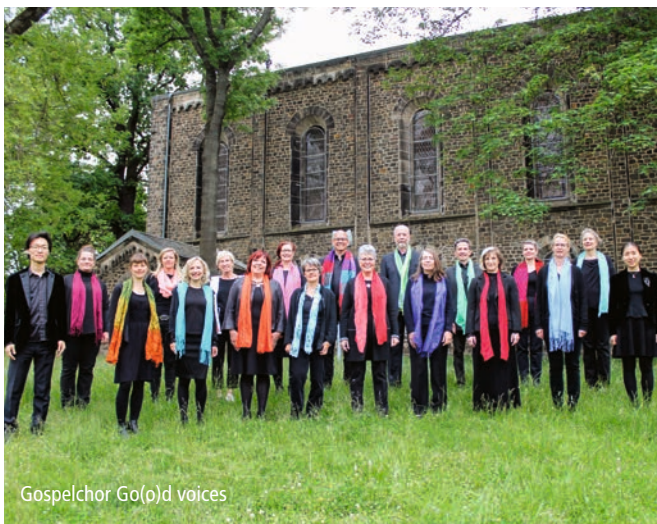
Gospelchor Go(o)d voices